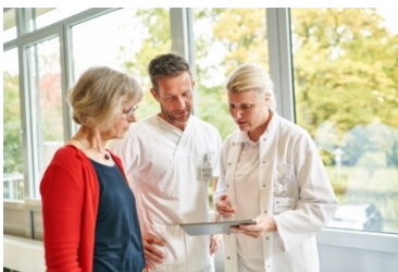
Ihre Perspektiven bei uns!